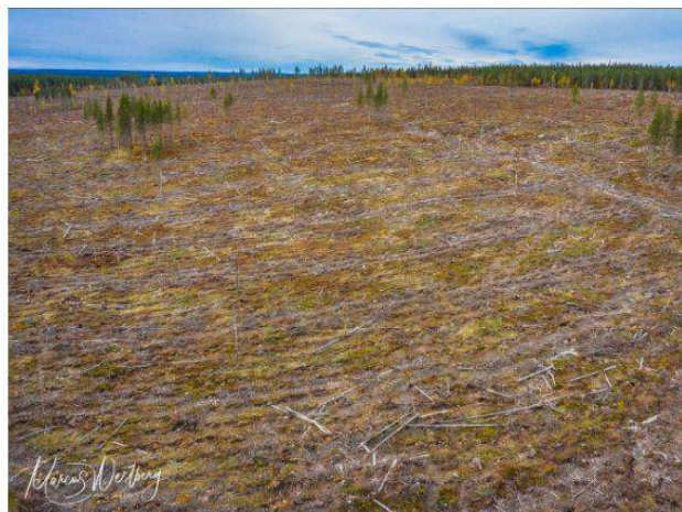
Sveaskogs kalhygge på Laitavaara i Pajala kommun.