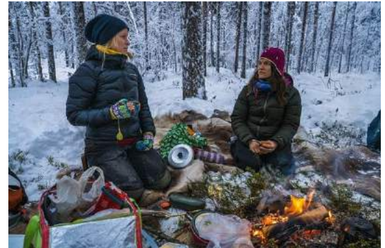
Panelssamtal runt elden om kampen i Sápmi