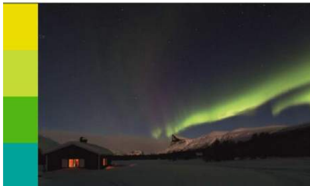
Jubileumskriften Aktse 75 år