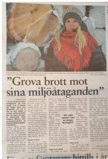
Både hopp och oro när Sveaskogs vd fick gå