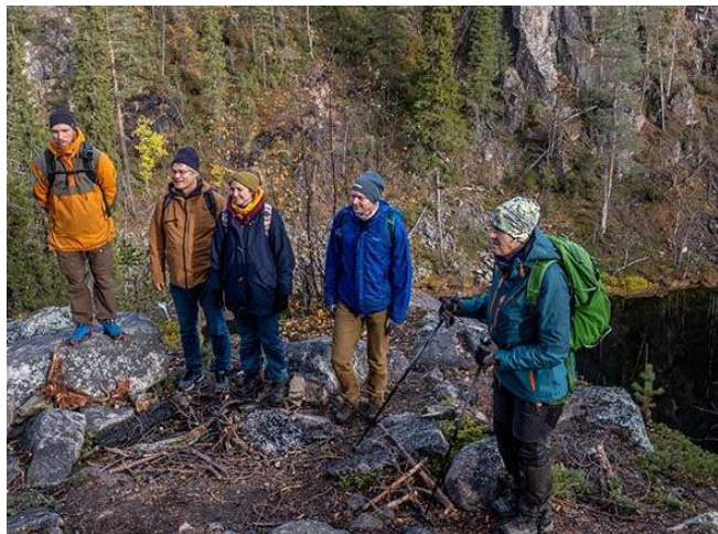
Styrelseträff i Gällivare/ Rävdaalen