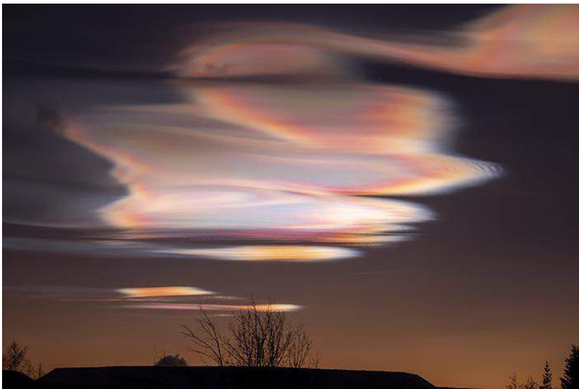
Pärlemormoln över Kiruna