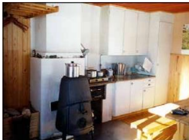
Köket i stora rummet.