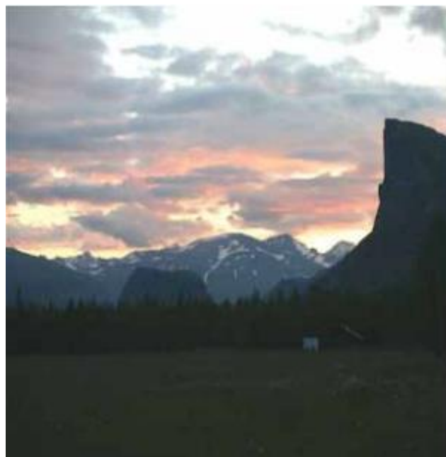
Skierfe, vaktposten in till Rapadalen. Nammatji bakgrunden.

Du kommer till Aktse med bil/taxi till Sitoälvsbron, en mils promenad och sedan båtskjuts över Laidaure, eller vandring längs Kungsleden från Saltoluokta eller Kvikkjokk.