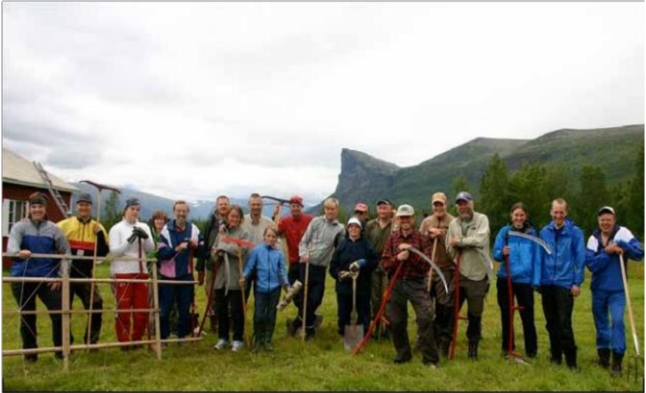
Slätter i Aktse.

Bokning är inte möjlig under slätterveckan, vecka 31. Avbokning: kan ske upp till 30 dagar innan hyrestillfället, en avbokningsavgift på 400 kr dras av på inbetalt hyresbelopp. Vid akut sjukdom etc. medges avbokning fram till dagen innan. Hyran faktureras i god tid innan hyrestillfället och ska vara betald innan man åker till Aktse.