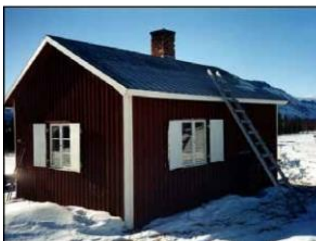
Stugan utifrån, vårvinter.