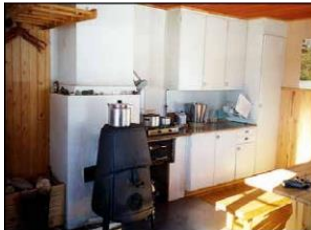
Köket i stora rummet.