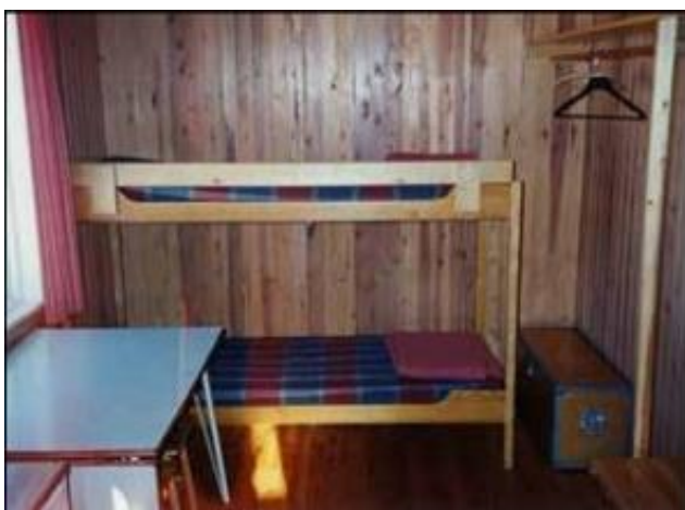
Lilla rummet, med två sängplatser.