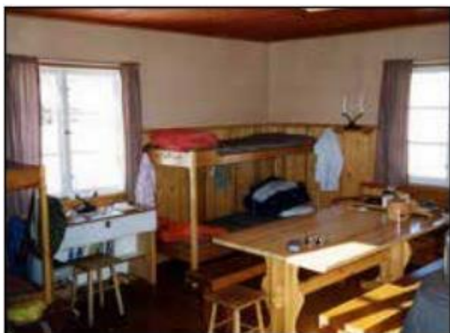
Stora rummet med matbord och 4 sängplatser.

Städning utförs av hyresgästen innan avfärd.