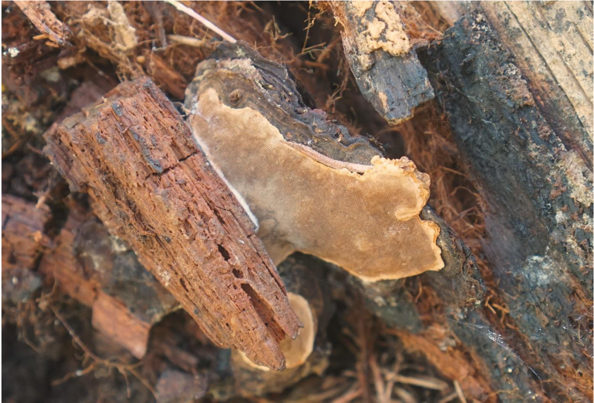
Gränsticka och stjärntagging