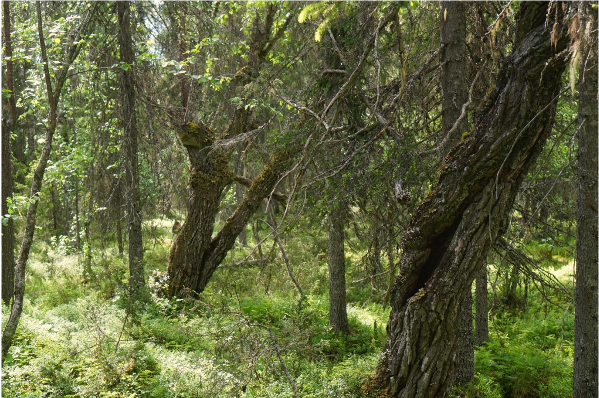
Gamla sälgar, lågor, lunglav och garnlav