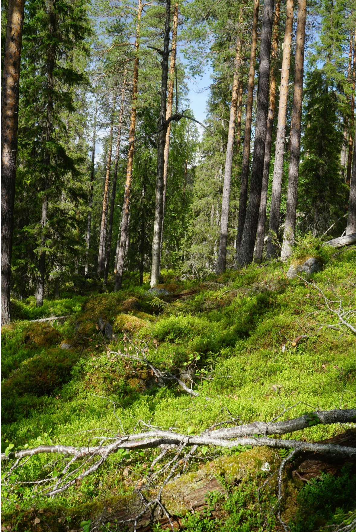
Lågor i olika nedbrytningsstadier...