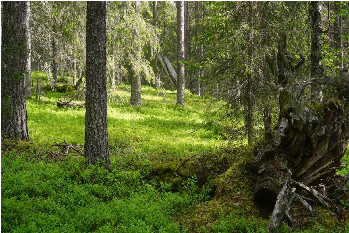
Lågor i olika nedbrytningsstadier...