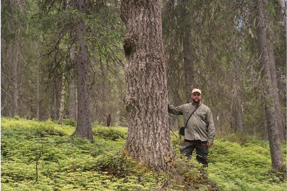
Största aspen mätte ca 70 cm i diameter i brösthöjd!