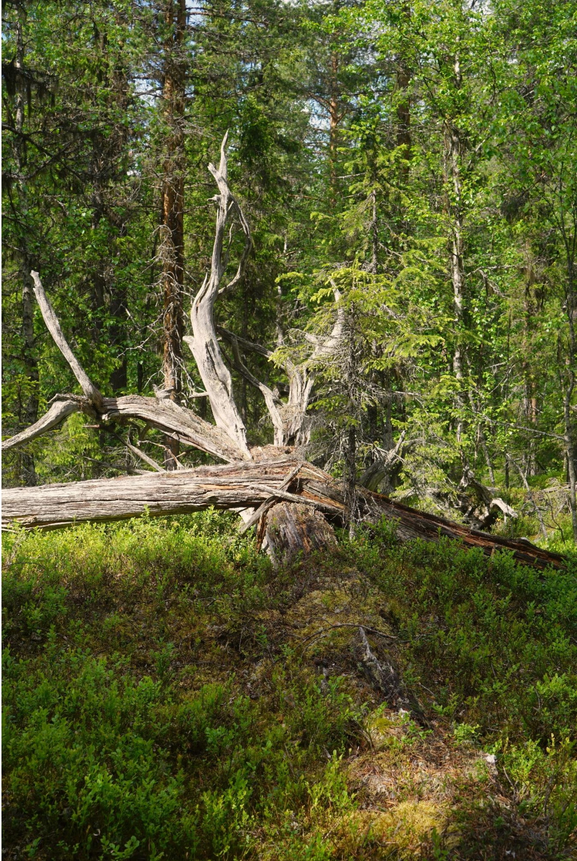
...inklusive urgamla exemplar