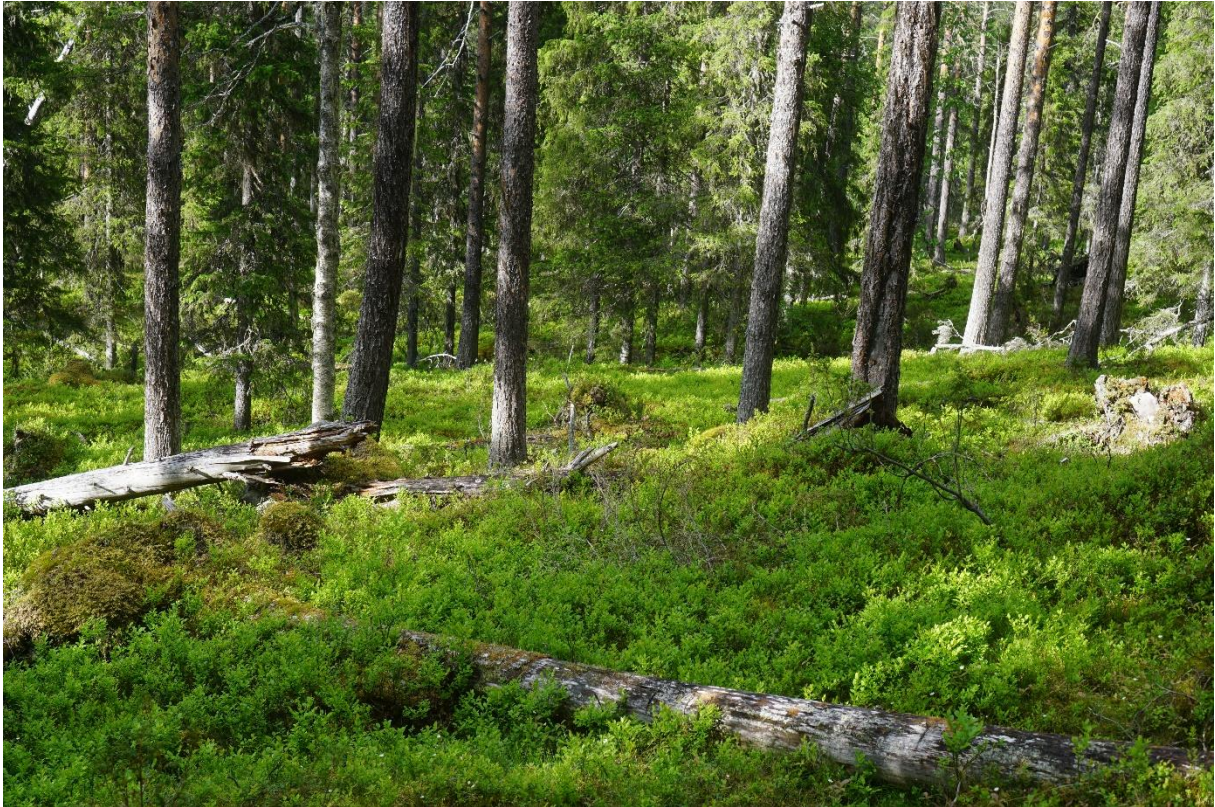
Tallågor i olika nedbrytningsstadier