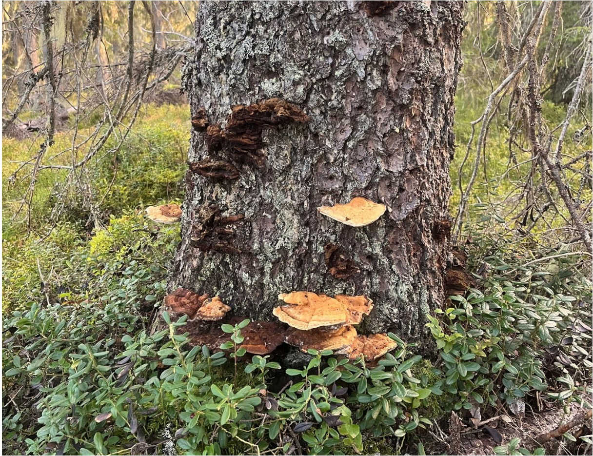
Harticka (NT) och rikligt med garmlav (NT)!