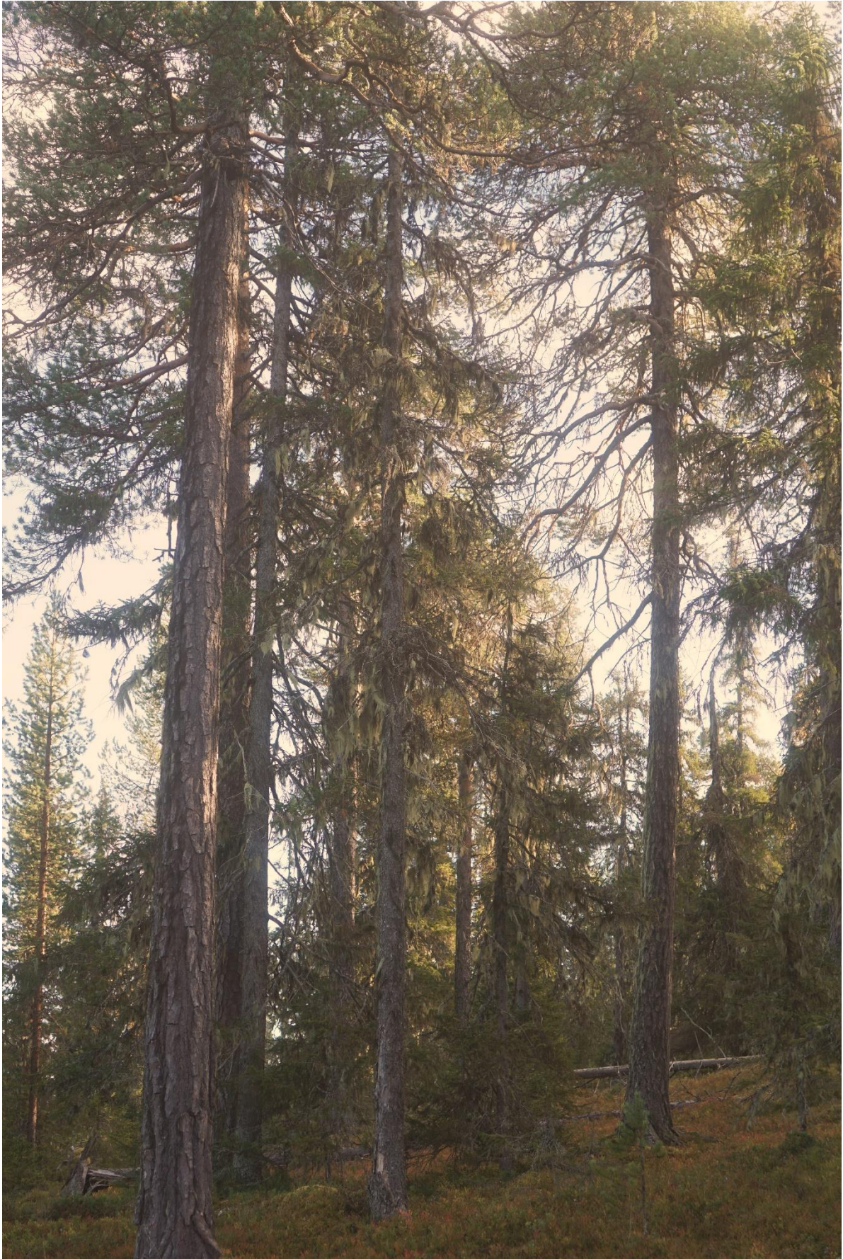
Gammeltallar på 200 – 300 år