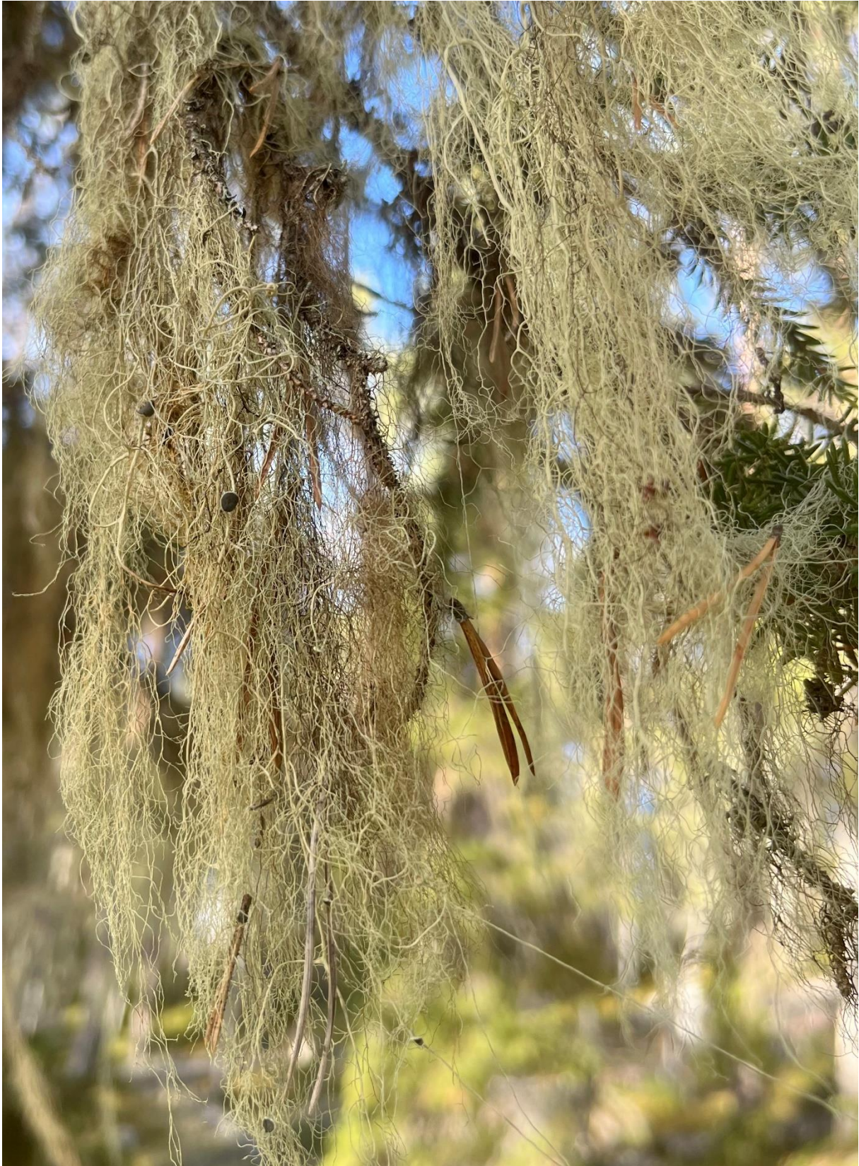
Fertil garnlav (NT) förekommer allmänt.