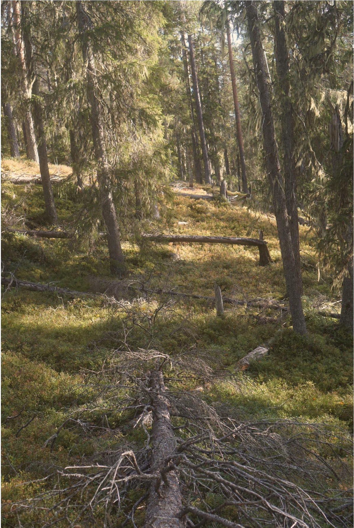
Naturskog med utspridd död ved i olika nedbrytningsstadier