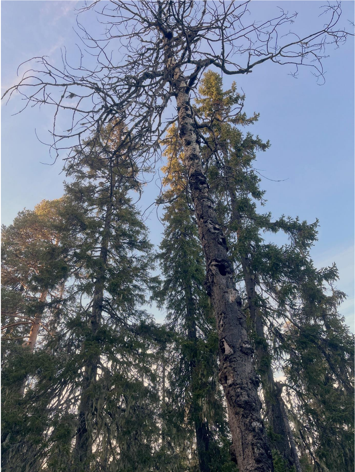
Urgammal asp med bohål lämpligt för pärluggla (NT).