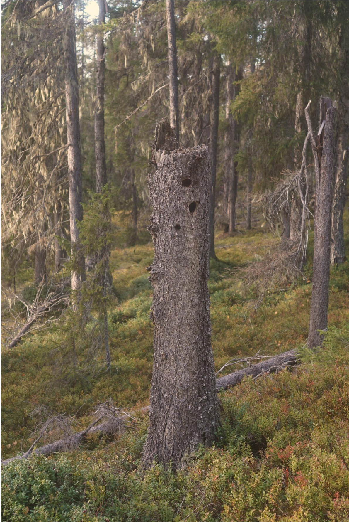
Påbörjat bohål av tretåig hackspett (NT).