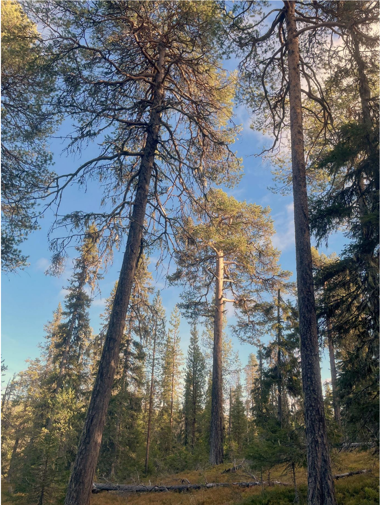
Tallar som är 200 – 300 år förekommer allmänt