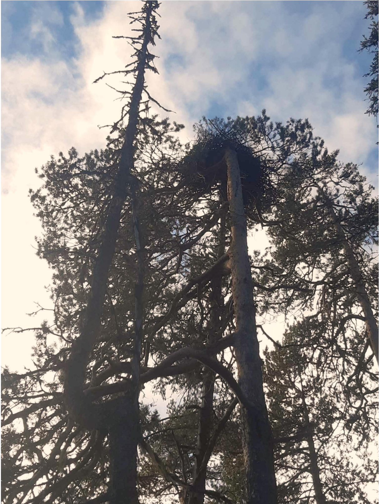
Duvhöksbo med skelett av mård på marken under.