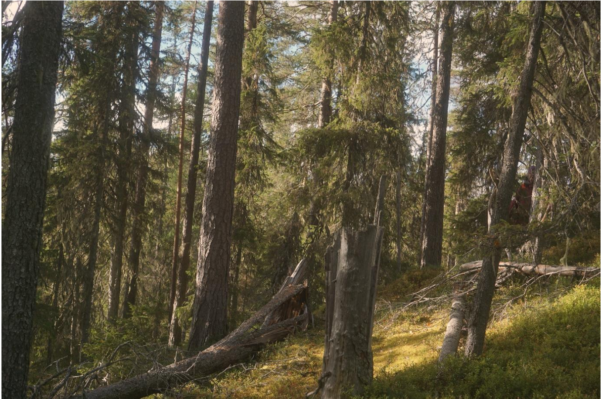
I sydsluttningen är skogen mer produktiv med gott om grova tallar och grov död ved.