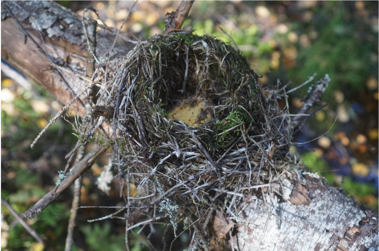
Bo av häckande rödvingetrast