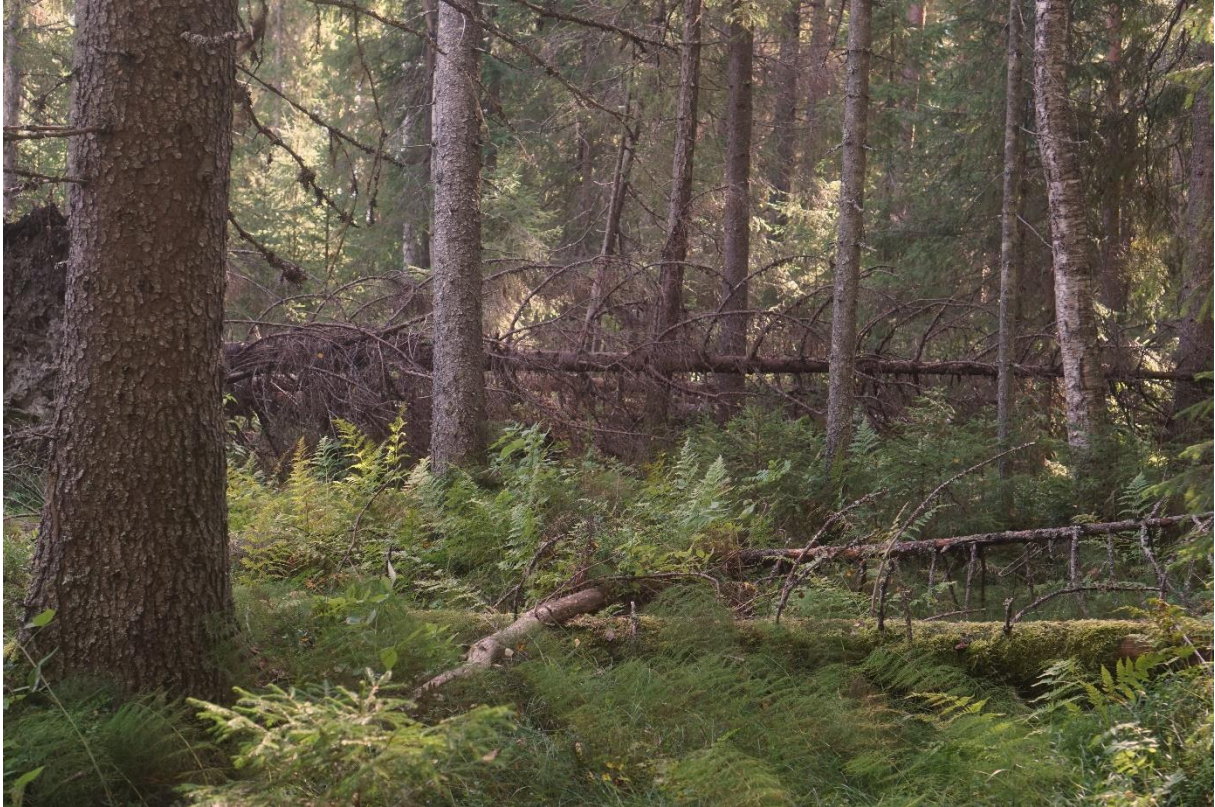
Död ved och grova träd