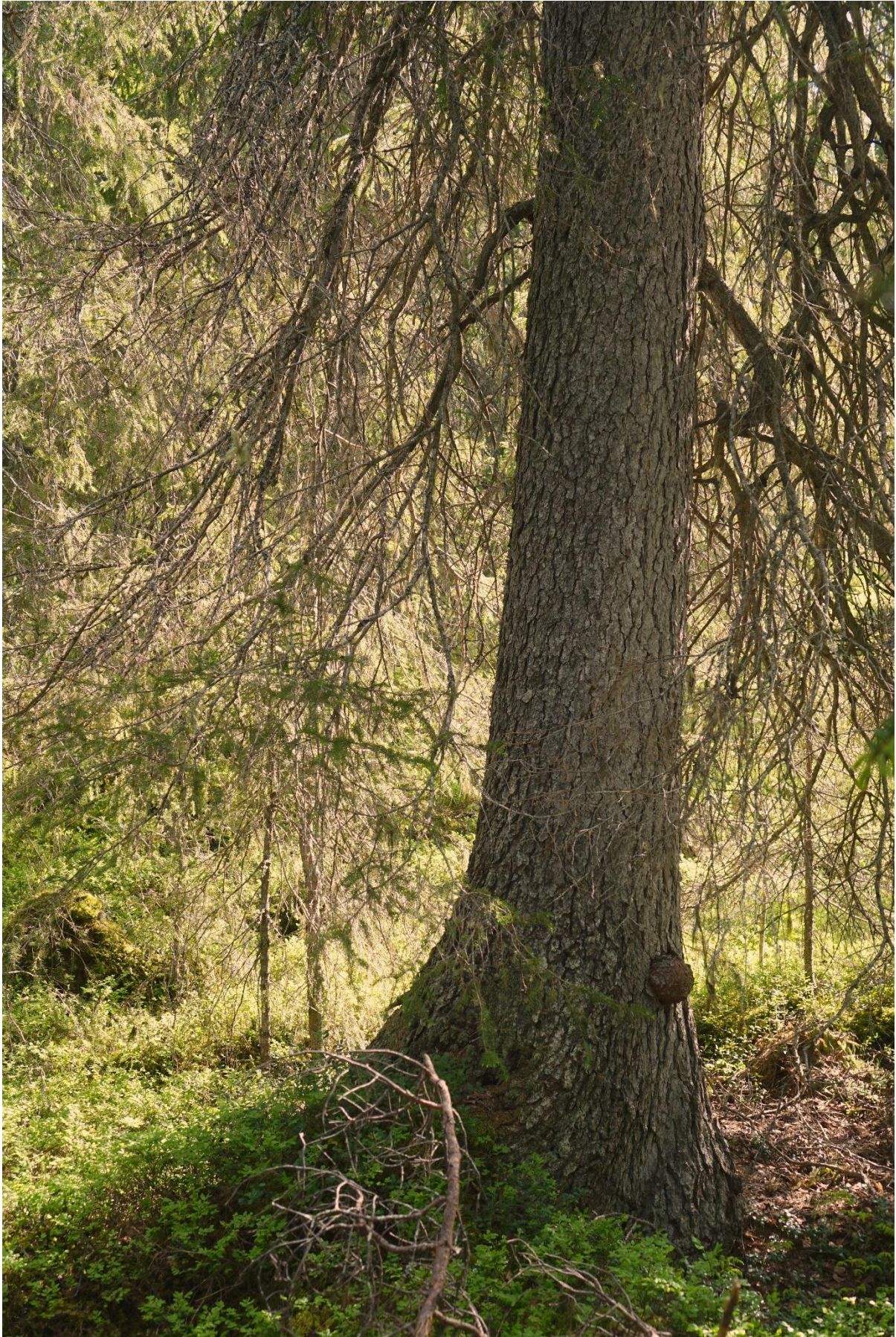
Den grövsta granen mätte över 75cm i diameter nere i roten!