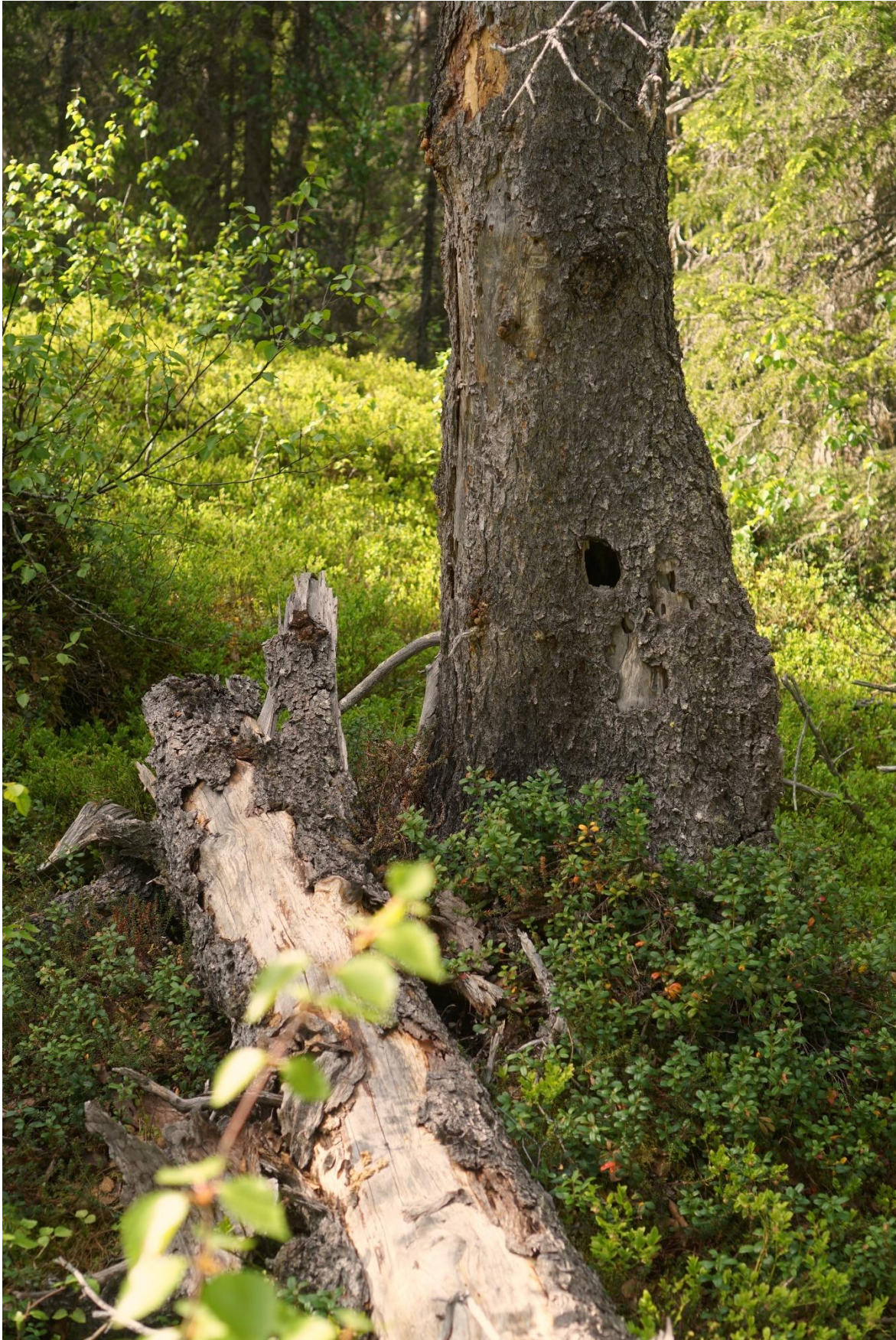
Hack från spillkråka (NT) i död gran