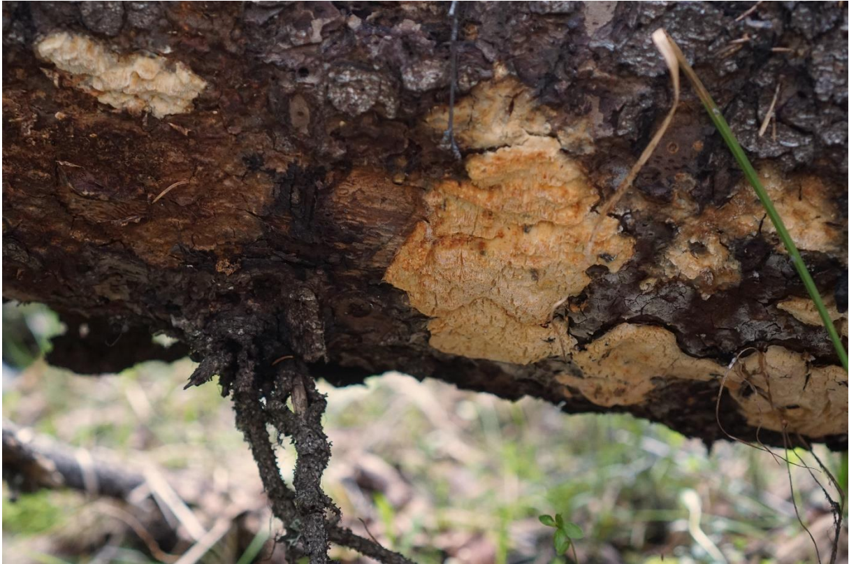
Ullticka , ostticka och granticka är några av de rödlistade arter som noterades vid det korta fältbesöket.