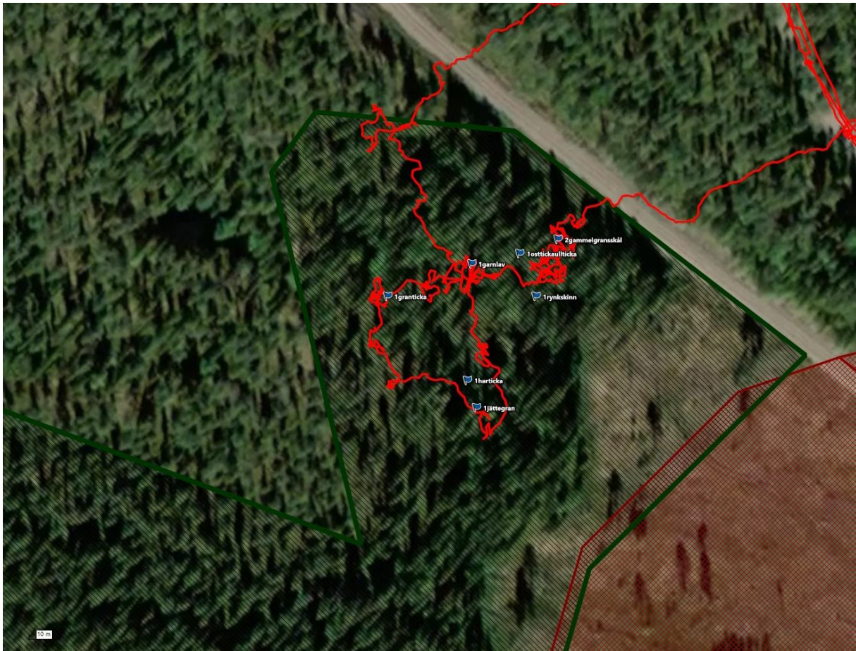
Ovan: förstorad bild över rutterna som inventerades (röd linje) samt artfynd (blå flaggor). Nedan: Avverkningsanmälan avgränsad med rosa linje