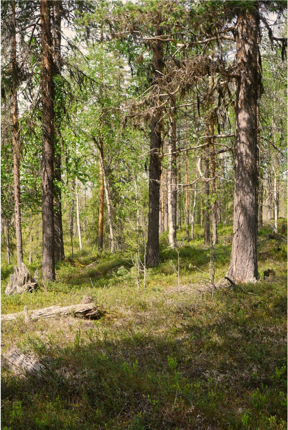
Vid ett besök på hösten går sannolikt fler rödlistade arter att finna