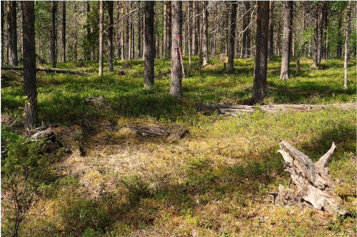
Bitvis förekommer en del gamla tallågor och lavbrunnar men bärris dominerar