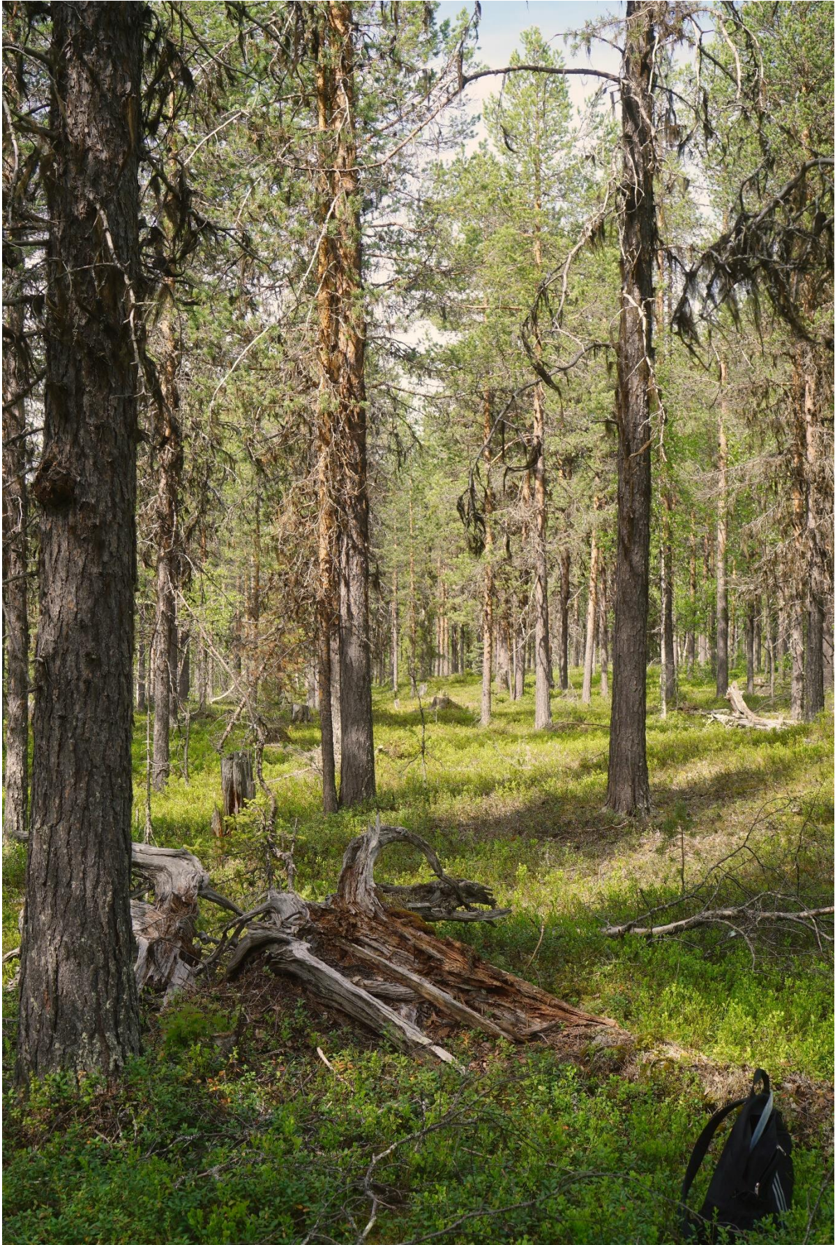
Ca 150 åriga tallar och rikligt med manlav samt en del gamla lågor