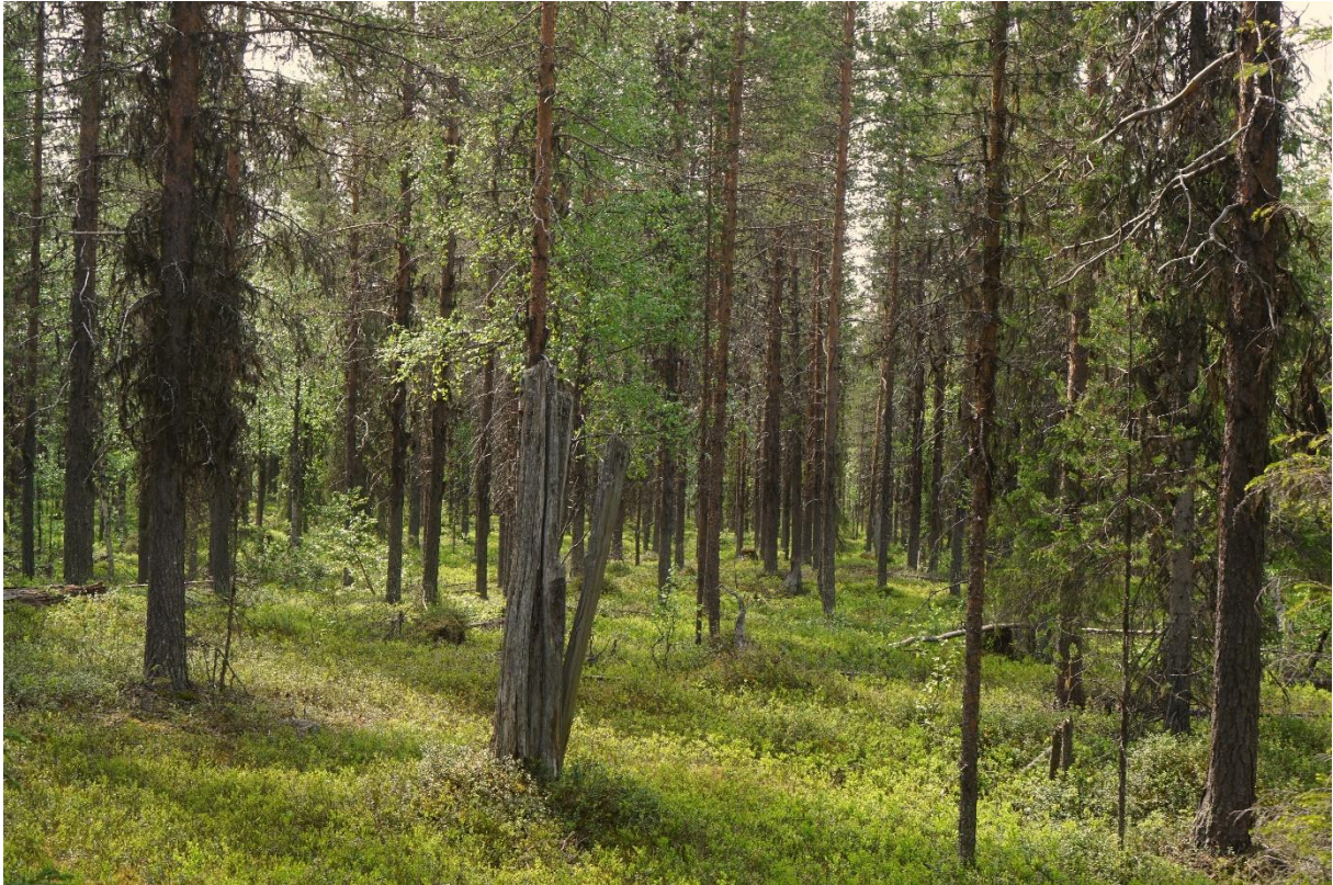
Tyvär ser ganska stora partier ut såhär, mest ca 80 – 100 åriga klenta tallar dominerar och tjockt med bärris.