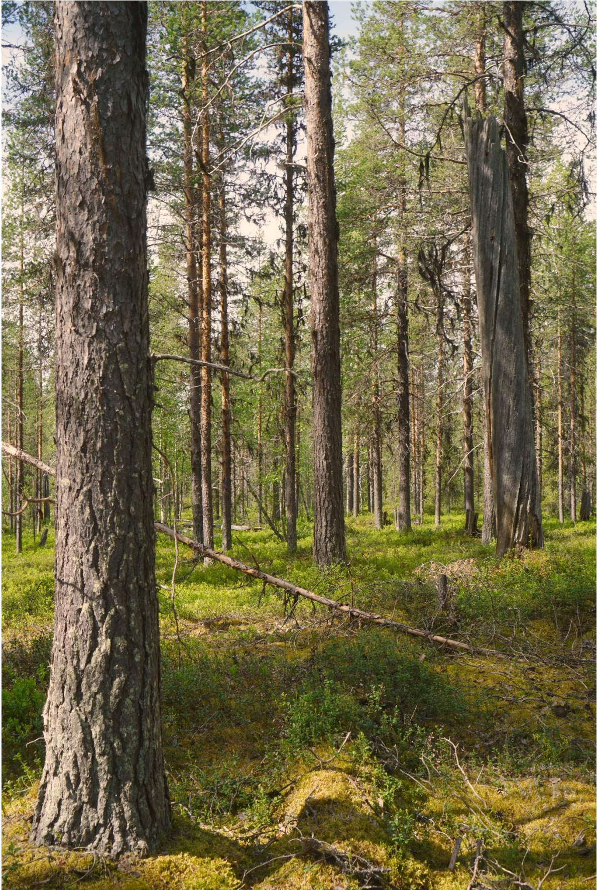
Tallöverståndare och död ved förekommer men sparsamt