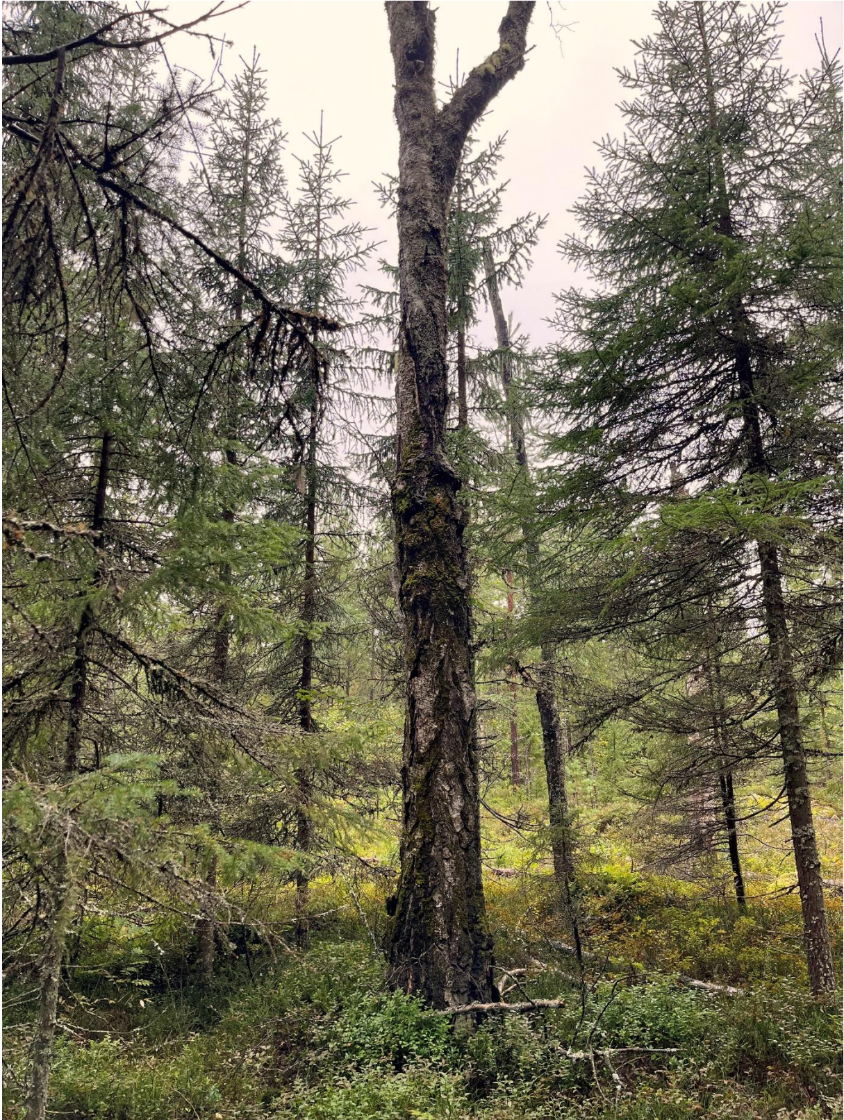
En mycket gammal björk i kanten av skogen