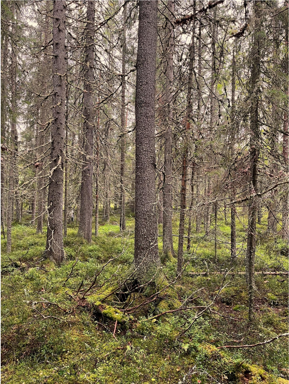
Gamla granar och en äldre, mosklädd låga