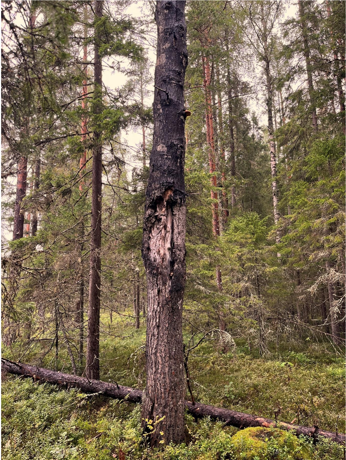
Stor aspticka (NT) på en gammal asp