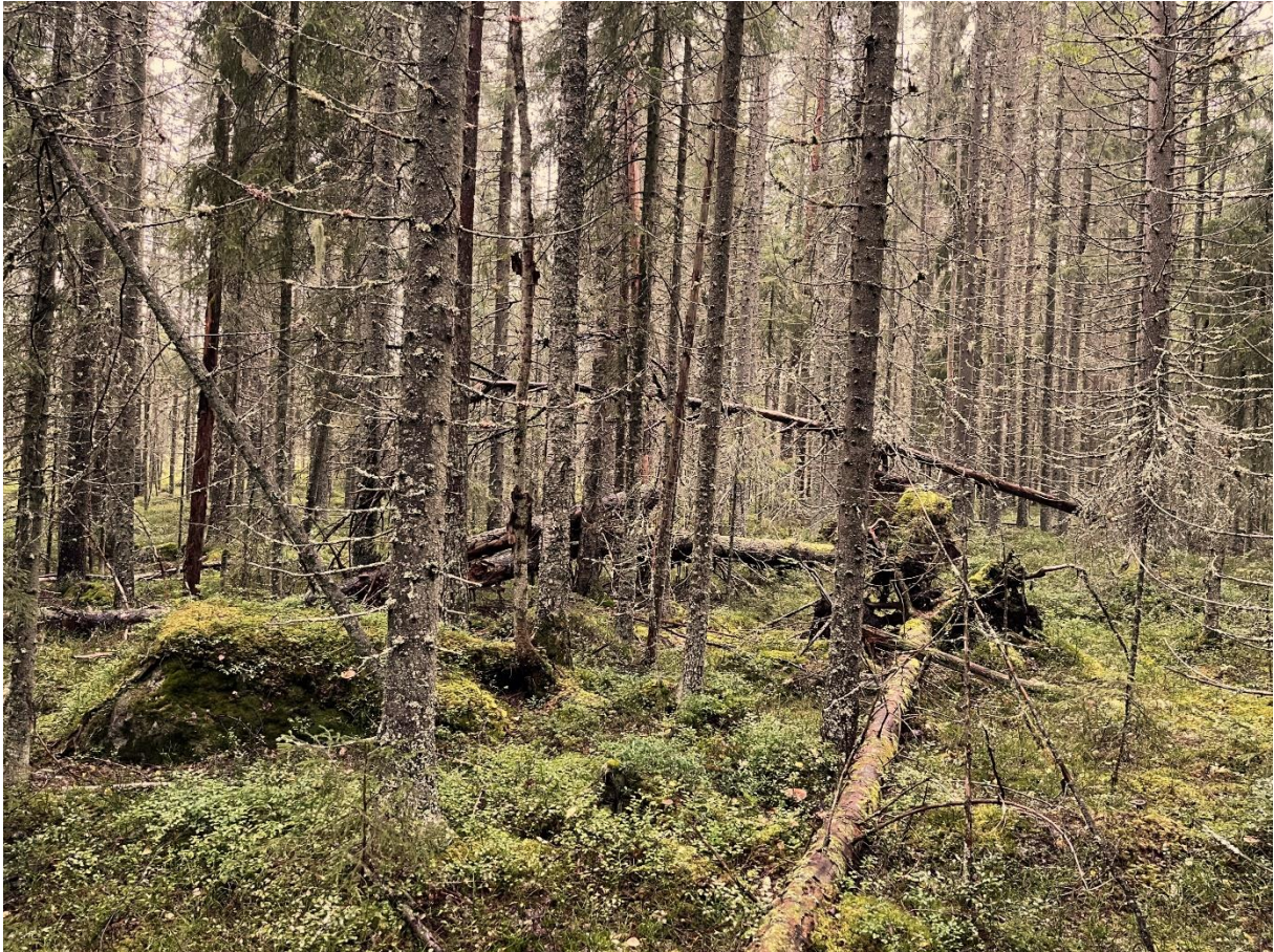
Främst färska lågor