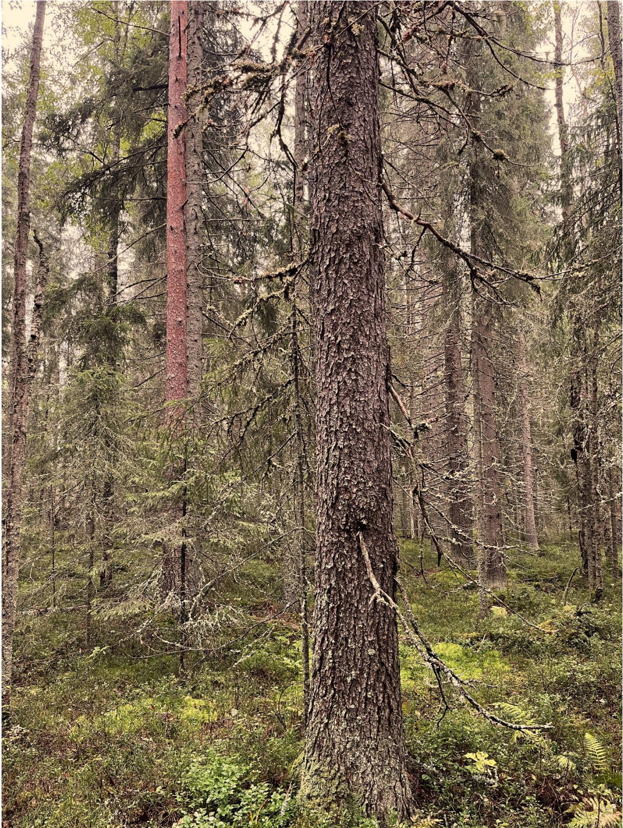
De äldsta granarna är 200-250 år gamla