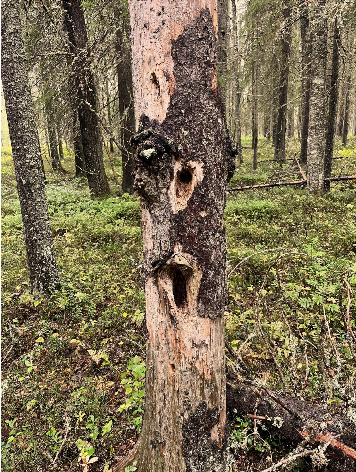
Hack från spillkråka (NT)