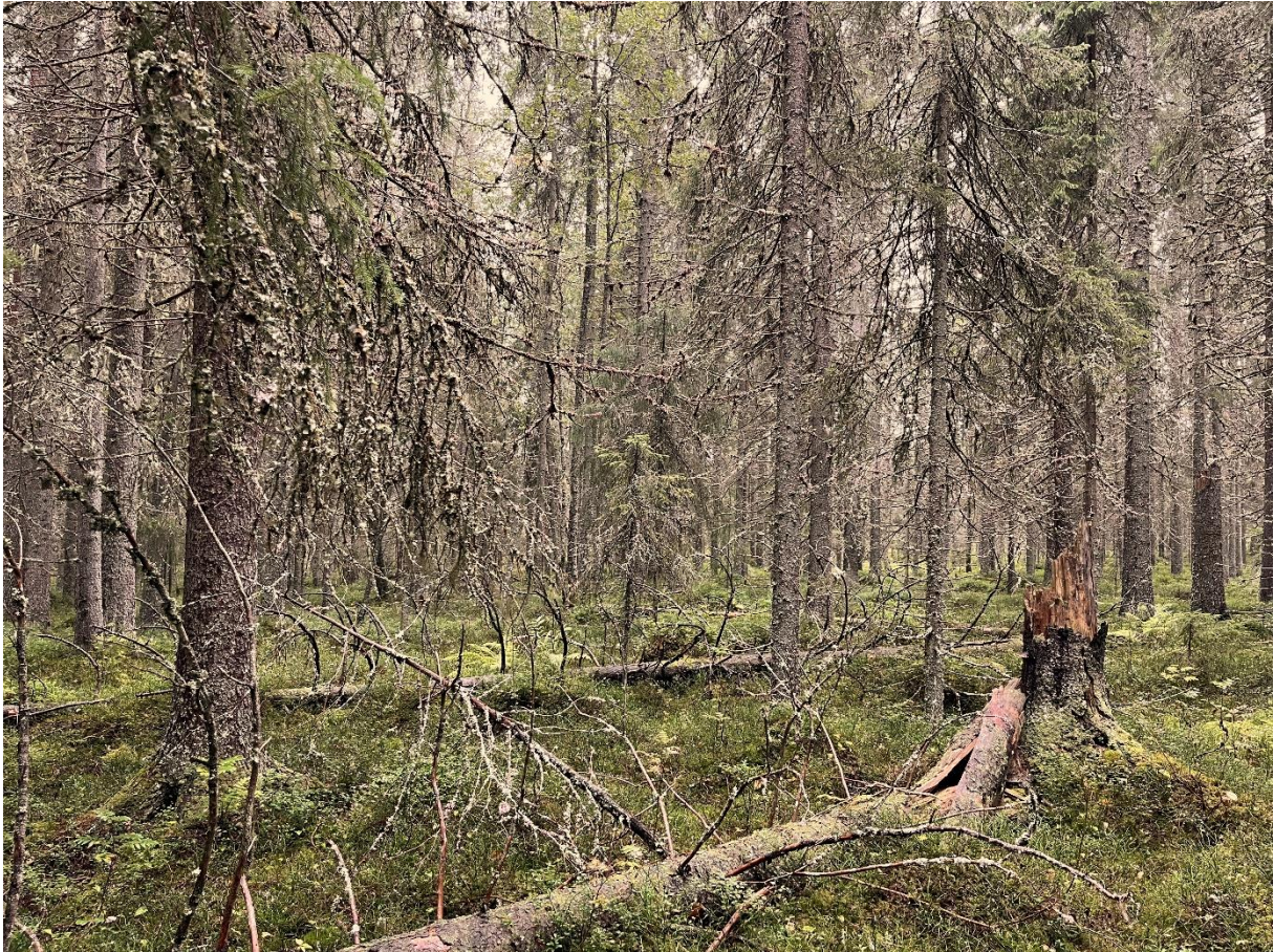
Färsk död ved