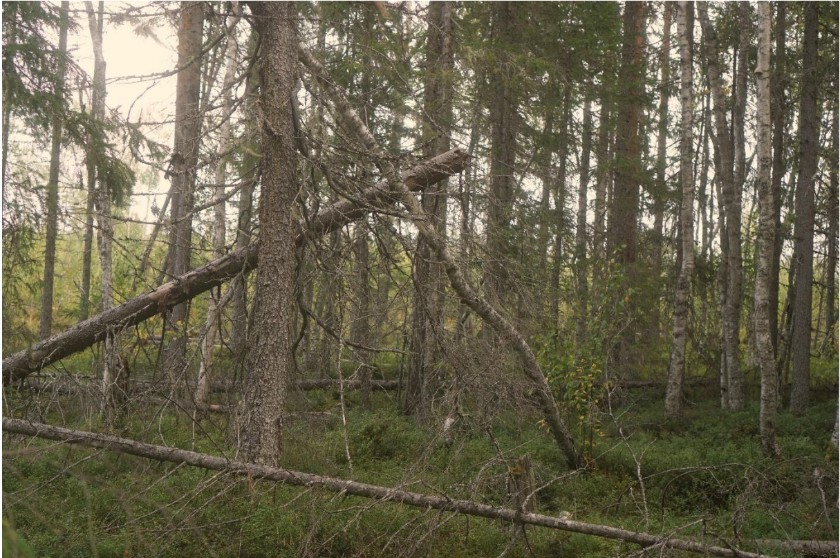
Gammelgranar i A 21104-2024