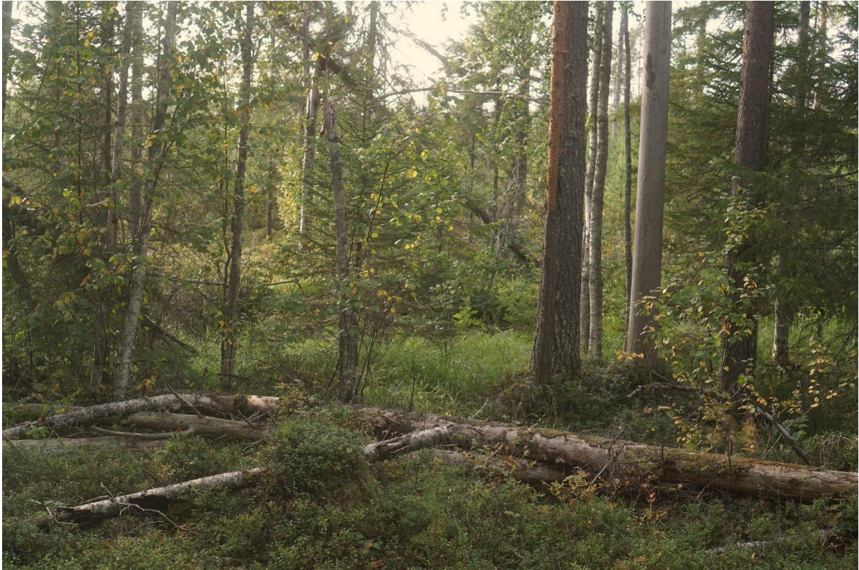
Död ved och rik mark- och buskvegetation i avverkningsanmälan A 21102-2024