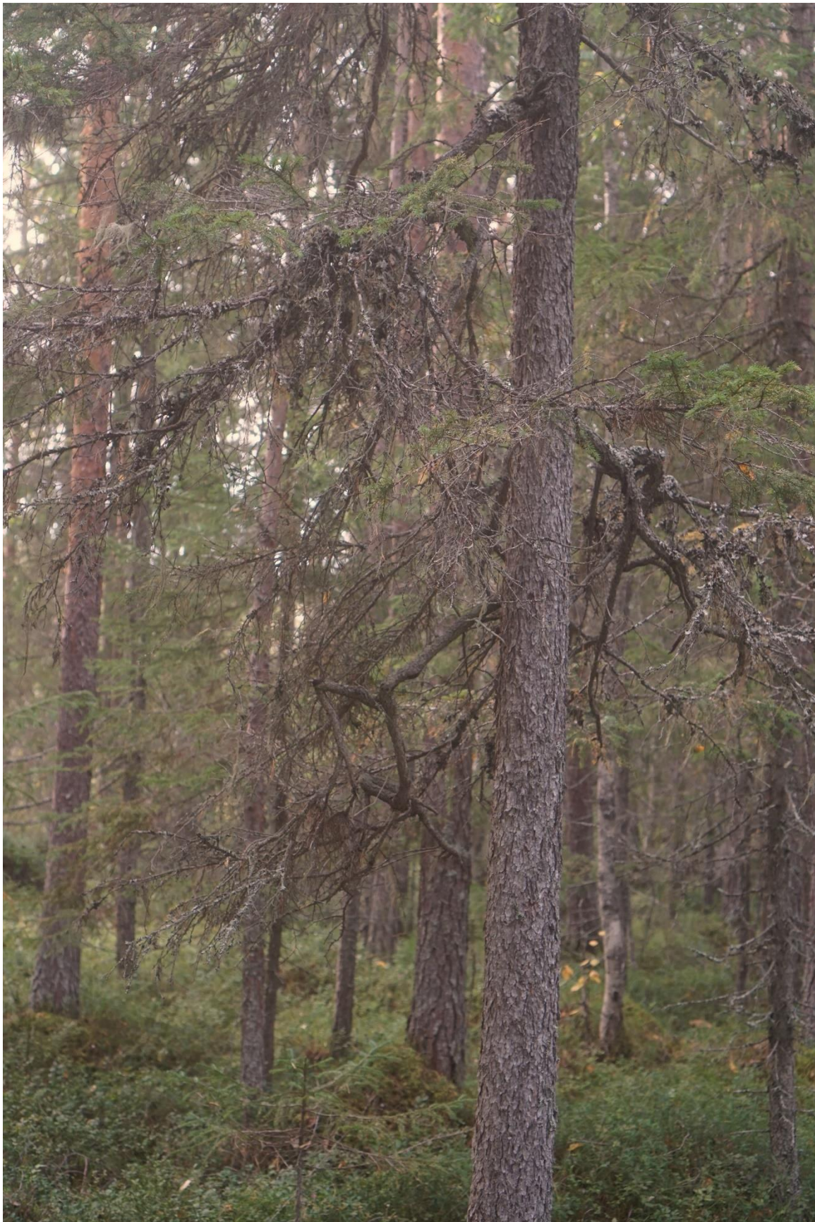
Urgammal gran i avverkningsanmälan A 21104-2024