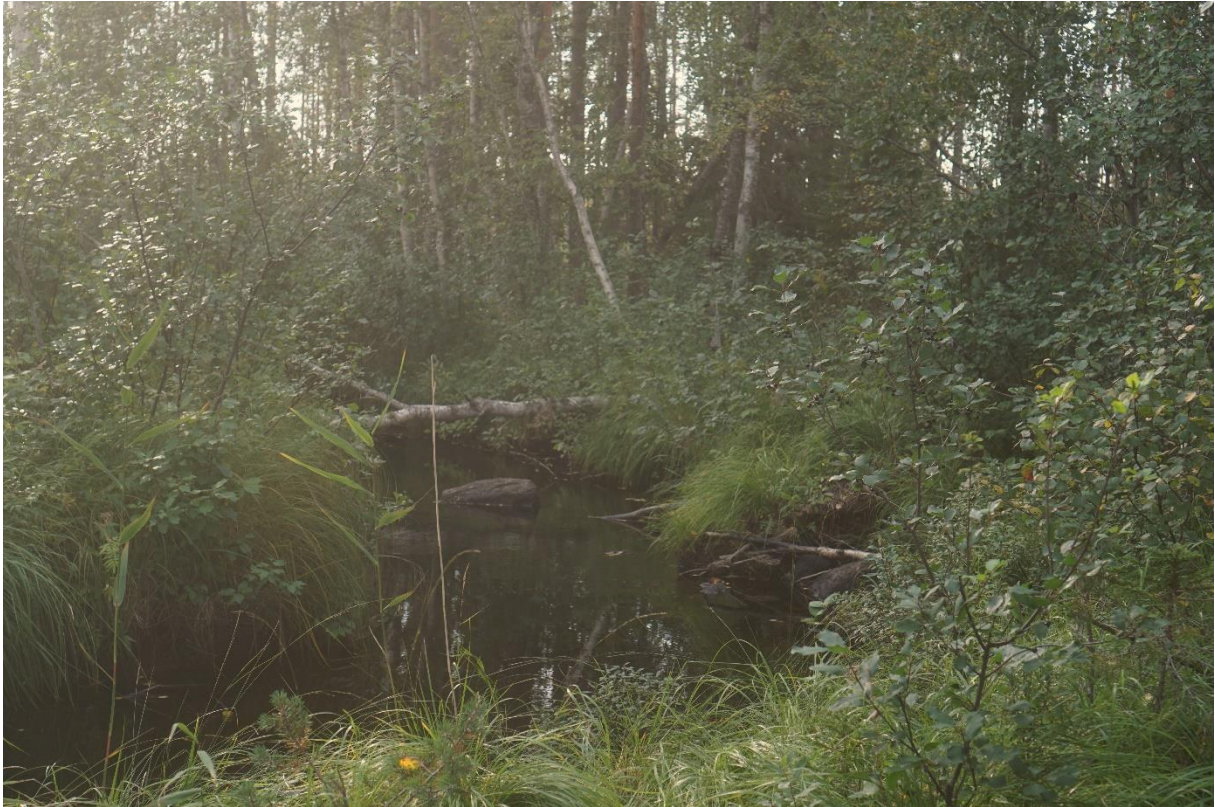
Mattesbäcken och kronan på en urgammal tall nära bäcken