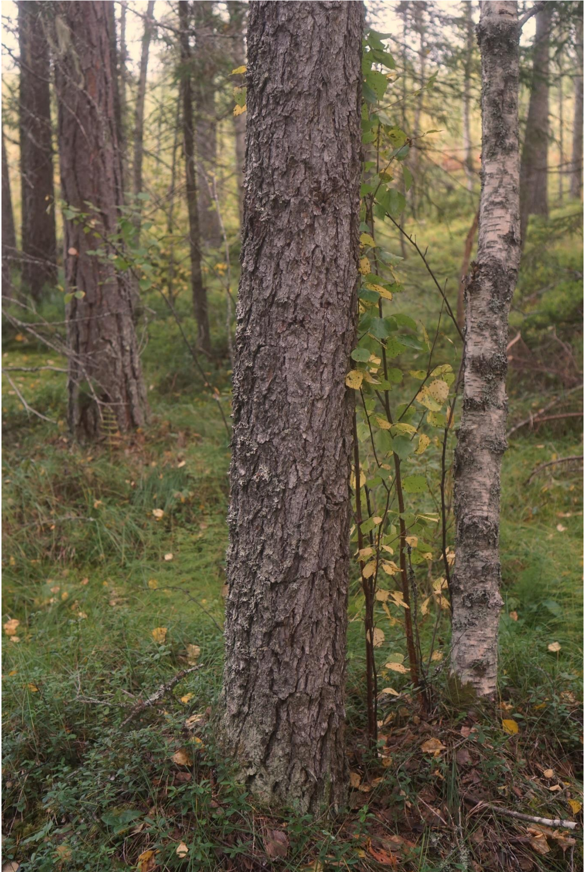
Gammelgransbark i A 21104-2024