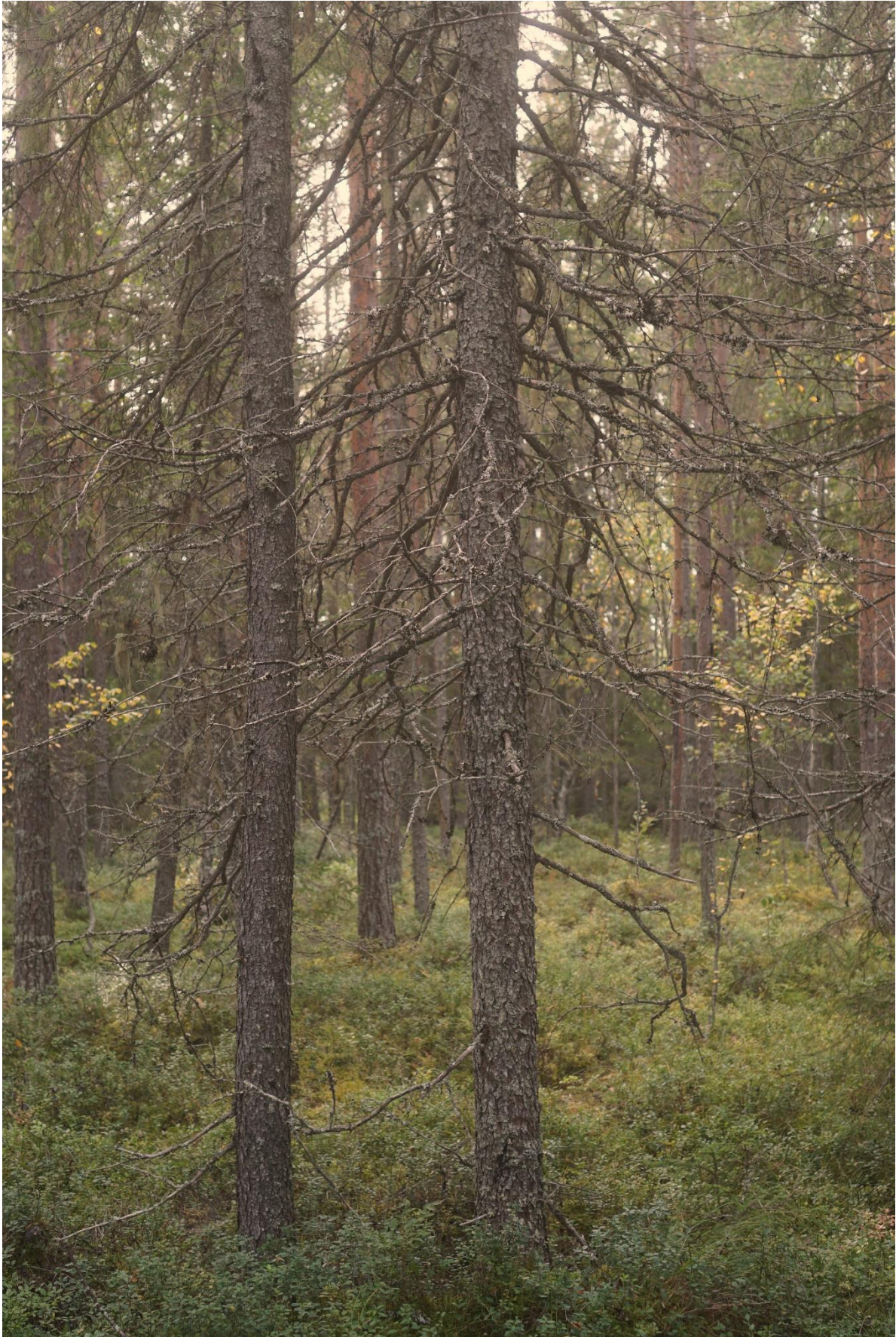
Senvuxna, klena gammelgranar med gammelgransskål i A 21104-2024