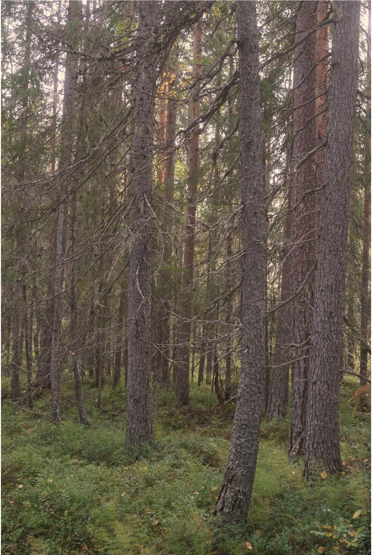
Gammelgranar i A 21104-2024