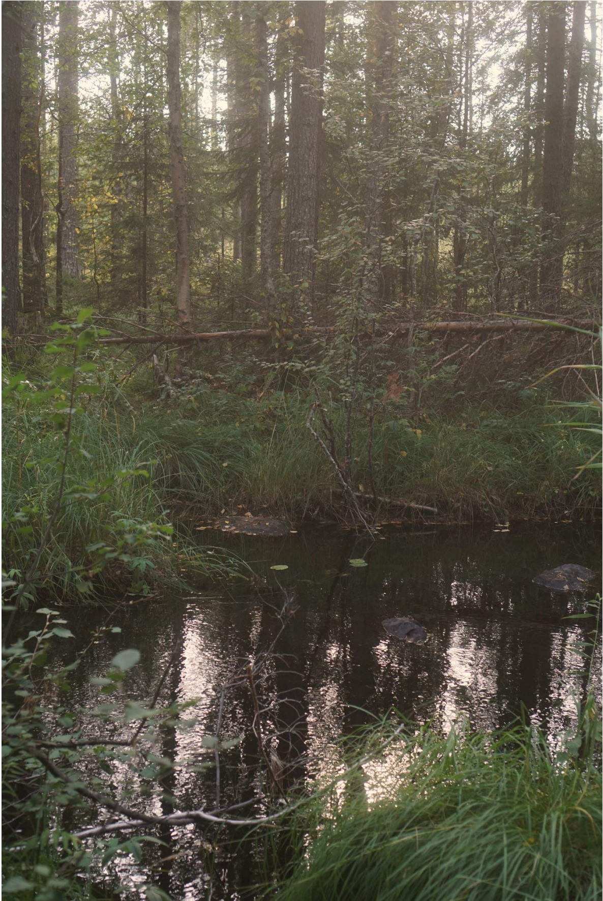
Mattesbäcken i A 21104-2024