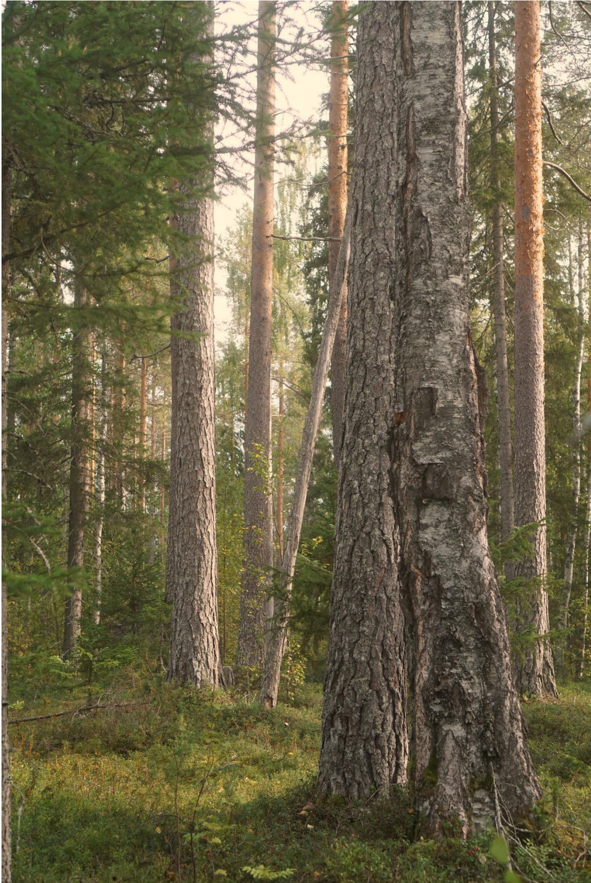
Grova naturvärde träd i A 21102-2024