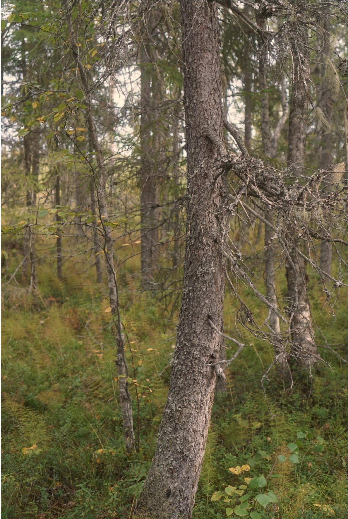
Urgammal gran i A 21104-2024