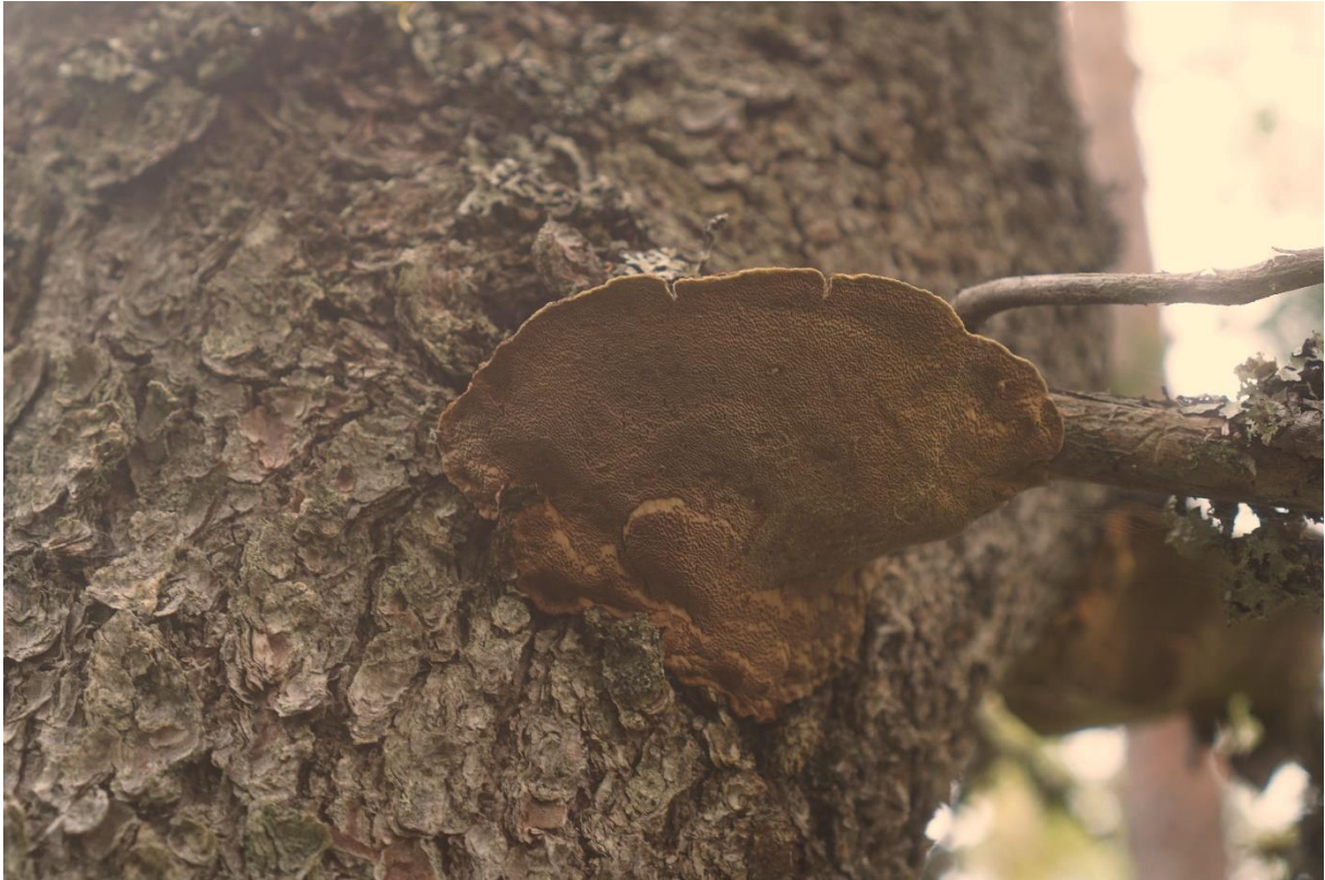
Granticka och lunglav i A 21104-2024