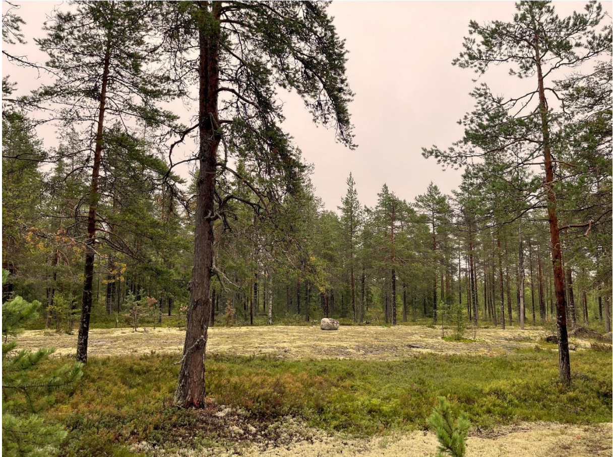
På och i anslutning till de små hållmarkerna fanns gott om naturvårdsarter...