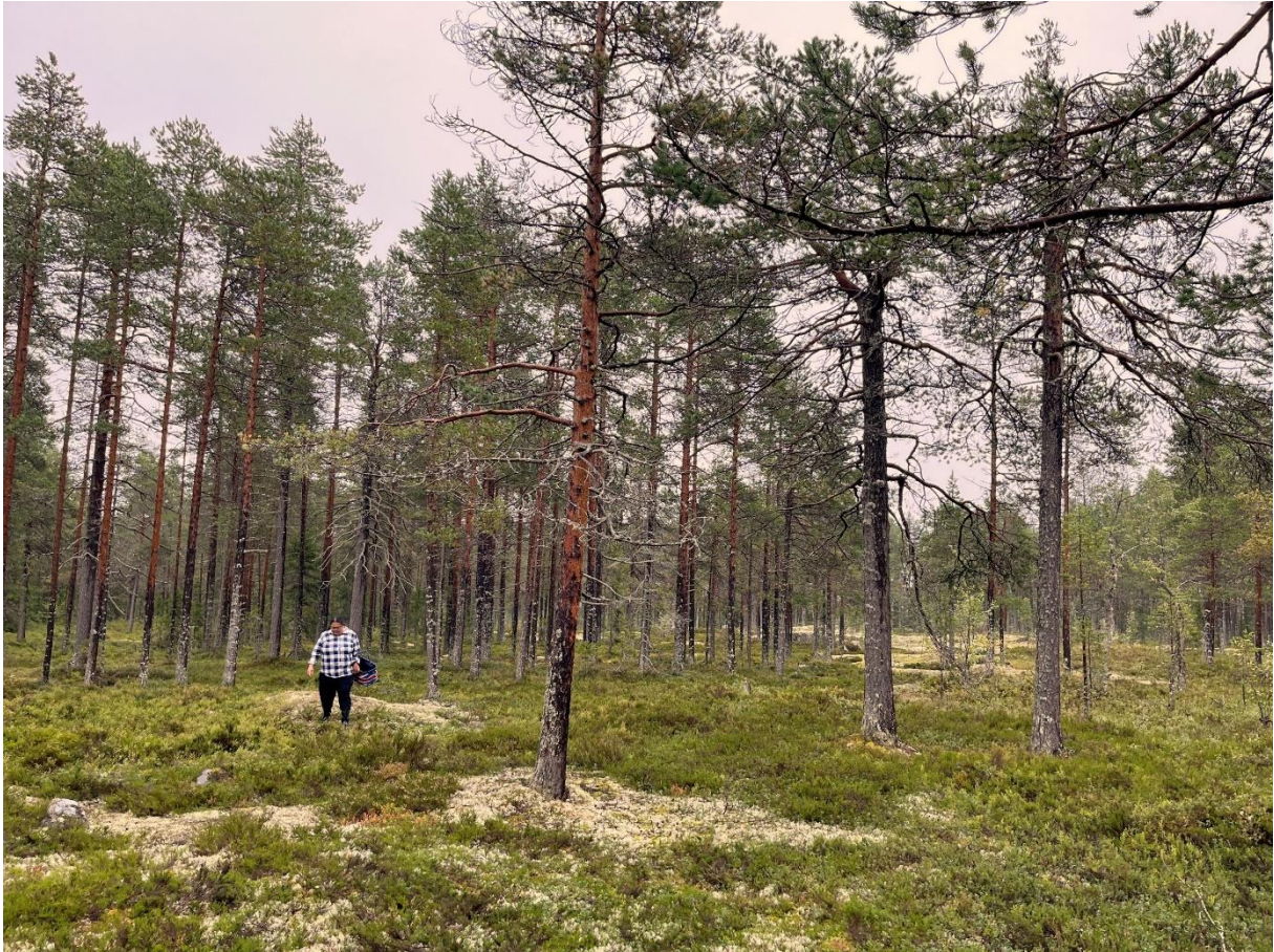
Flerskiktad gammal tallskog