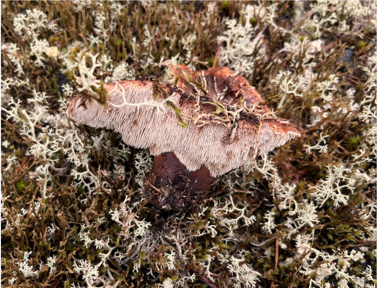
...bl.a. talltaggsvamp (NT) och skrovlig taggsvamp (NT).