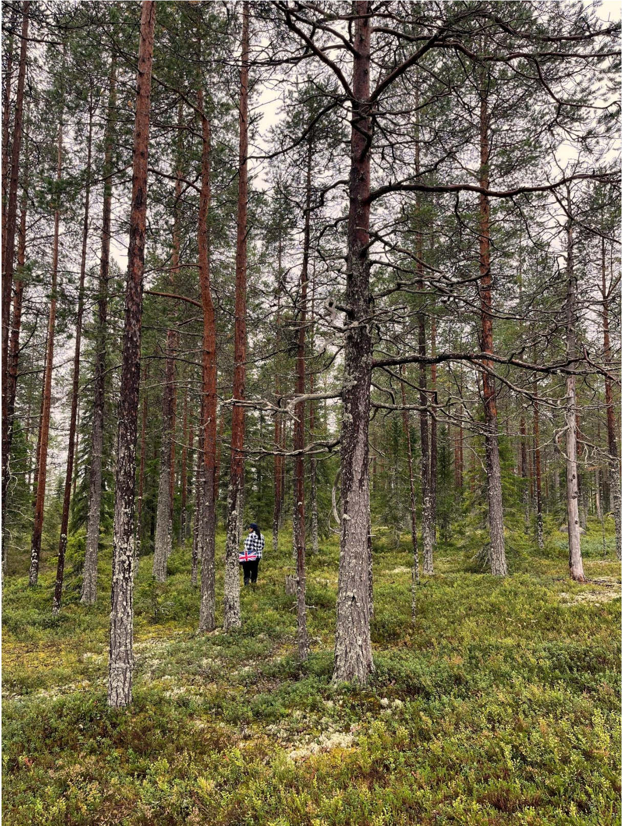
200 – 300 år gamla tallar förekommer