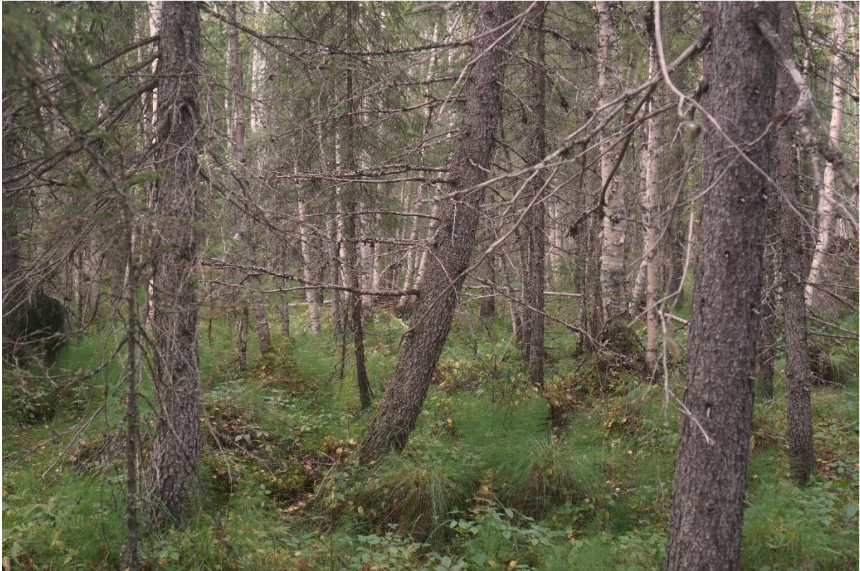
Gamla, senvuxna granar med gammelgransskål. Nedan: tibast